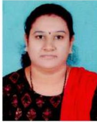
सौ.संपदा धोटे लिपीक